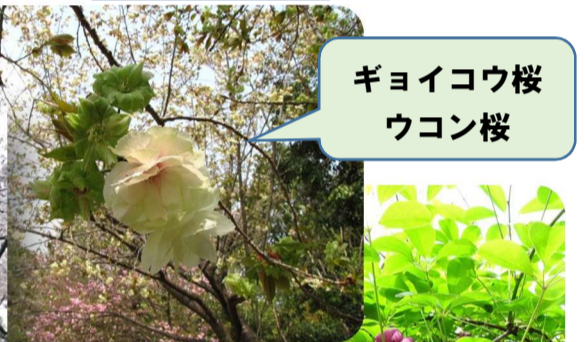
ギョイコウ桜 ウコン桜