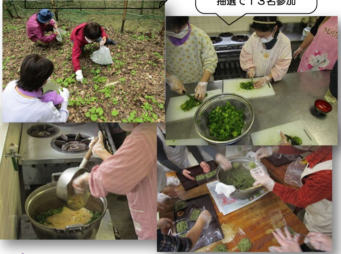
春の味は、ちょっと 苦くて、ツウ好み 抽選で13名参加