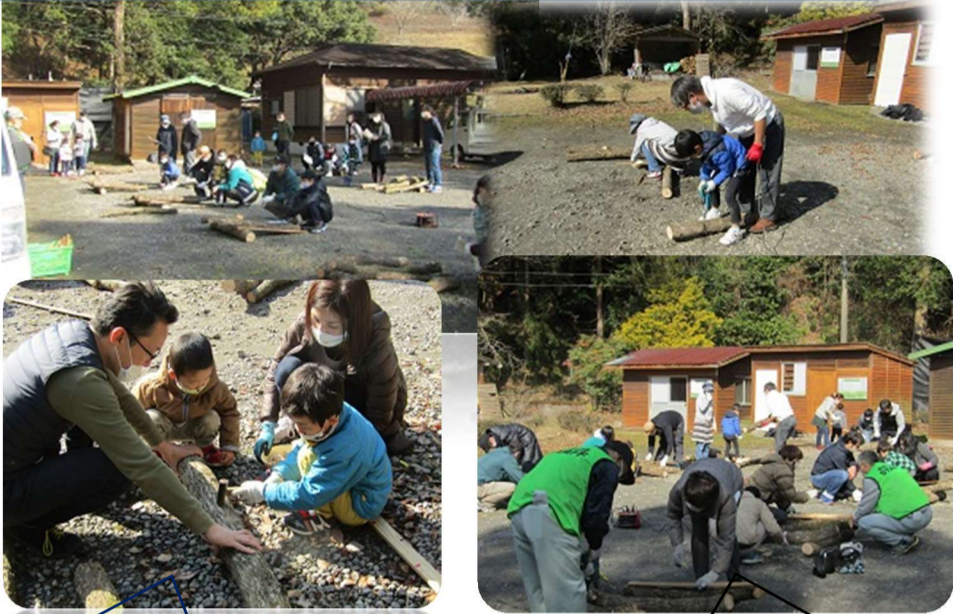
来年の秋には 食べられるかな